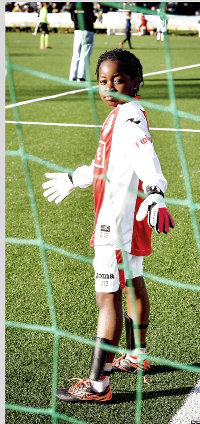
→ Love Football Cup Charleroi

«À terme, nous voulons les voir officier comme entraîneuses, membres du conseil d'administration, ou ambassadrices Futbalista dans chaque club, et également gérer en tant que personne de contact et en tant que responsable